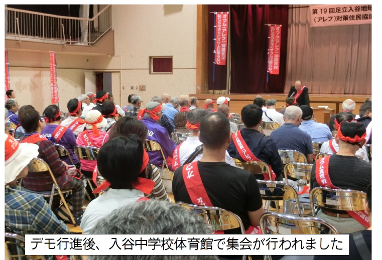
デモ行進後、入谷中学校体育館で集会が行われました