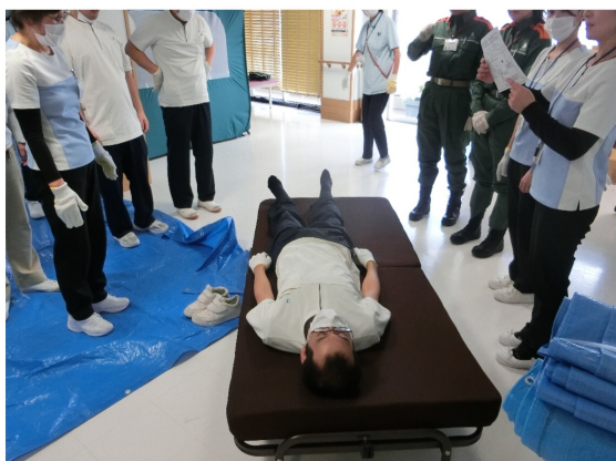
簡易ベットは救護用のため貸出なしです